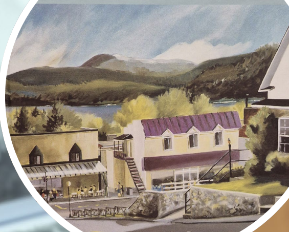
Société historique de Saint-Donat